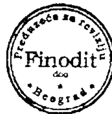
Marko Brkić Ovlašćeni revizor Finodit doo, Imotska 1 Beograd